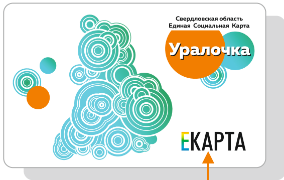
Логотип Транспортной карты ЕКАРТА